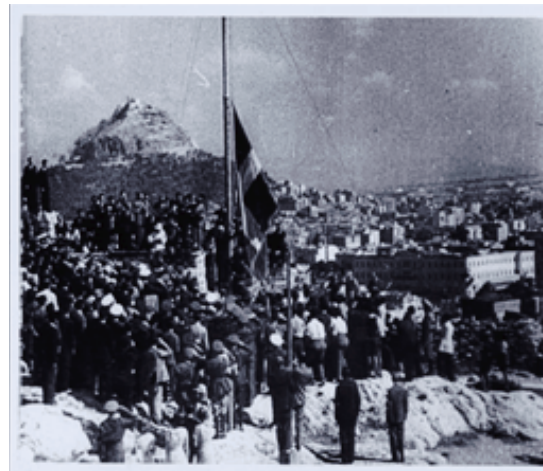
12-10-1944 Ο Πρωθυπουργός της απελευθέρωσης Γ. Παπανδρέου υψώνει την Ελληνική Σημαία στον ιερό βράχο της Ακρόπολης.