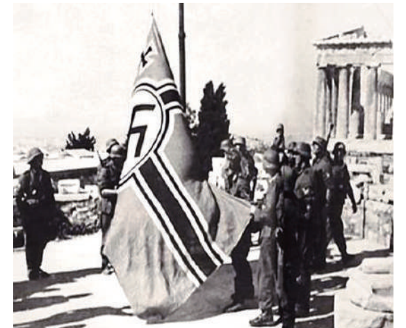
12-10-1944 Οι Γερμανοί υποστέλλουν τη γερμανική Σημαία στον ιερό βράχο της Ακρόπολης.

Ο Συνταγματάρχης Μακρυγιάννης , ο λαϊκός αυτός Άνθρωπος, για να γράψει το μοναδικό και ανεπανάληπτο έργο του αναγκάστηκε να μάθει γράμματα σε μεγάλη ηλικία στα μοναστήρια. Δικαιολογεί την πράξη του αυτή, σαν ελάχιστη υποχρέωση απέναντι στους προγόνους του που θυσίαστηκαν για την απελευθέρωση της πατρίδας Ελλάδας. Το μήνυμά του προς όλους τους Έλληνες «έχουν υποχρέωση να γνωρίζουν την ιστορία, να γράφουν την ιστορία και να την μεταδίδουν στους απογόνους τους» . Η γνώση της ιστορίας μας, κράτησε τόσες χιλιετηρίδες ζωντανό τον Έλληνα.