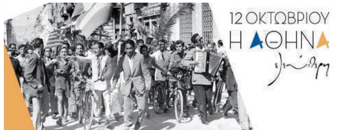
Ιστορίας γνώσεις. Οι Αθηναίοι γιορτάζουν την πρώτη ημέρα της απελευθέρωσης της Αθήνας

Γράφει ο Γιάννης Αβραμίδης (Σμχος ε.α) Πηγές: εγκυκλοπαίδειες