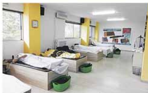
Χώρος Δοκιμής Υπερσύγχρονων Μηχανημάτων