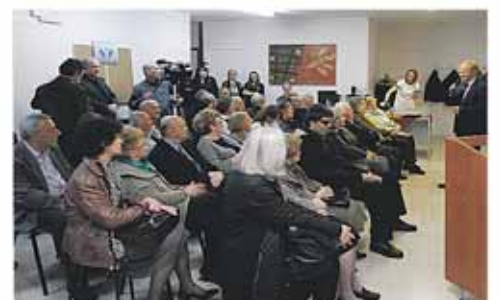
Πληθώρα Προσέλευσης Ασθενών