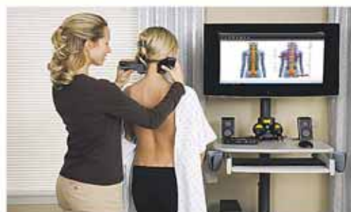
Επιμέτρηση Σπονδυλικής Στήλης