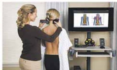
Επιμέτρηση Σπονδυλικής Στήλης