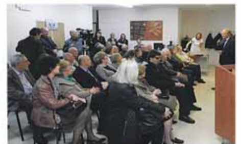
Πληθώρα Προσέλευσης Ασθενών