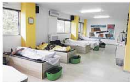
Χώρος Δοκιμής Υπερσύγχρονων Μηχανημάτων