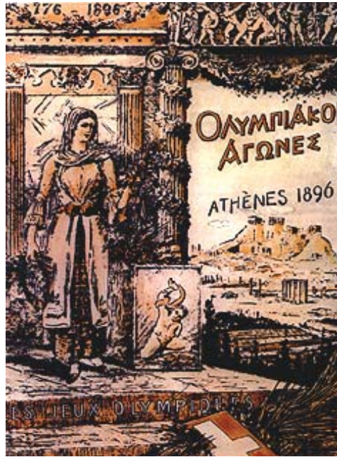
Η αφίσα των πρώτων Ολυμπιακών αγώνων

Ο Λεωνίδας Πύργος είναι ο πρώτος χρονολογικά Έλληνας χρυσός ολυμπιονίκης στην ιστορία των σύγχρονων Ολυμπιακών Αγώνων. Κέρδισε το