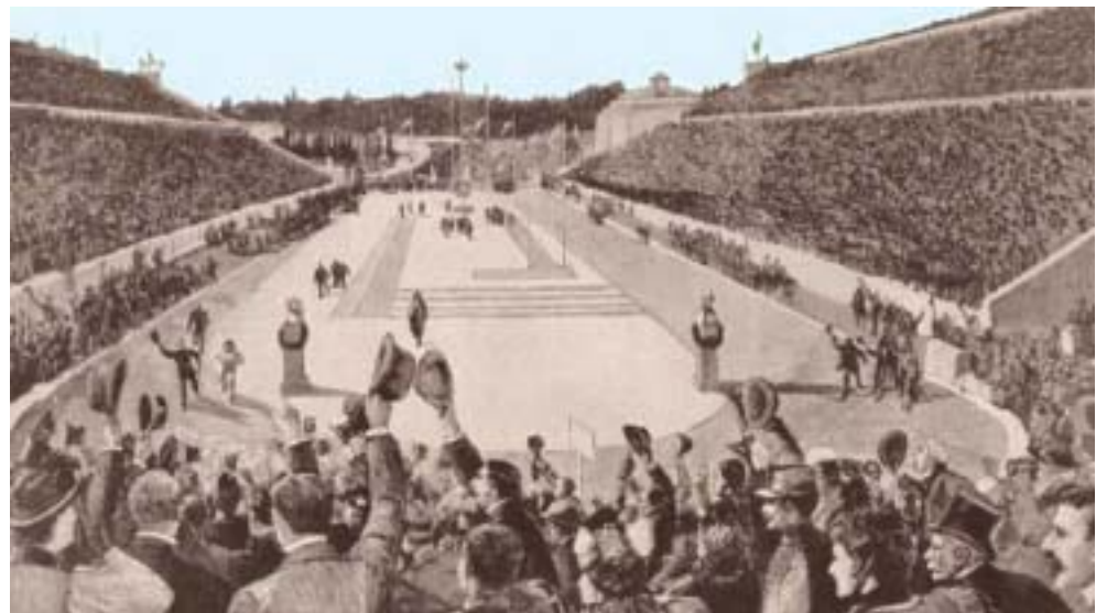
Το Καλλιμάρμαρο κατά τη διάρκεια των αγώνων