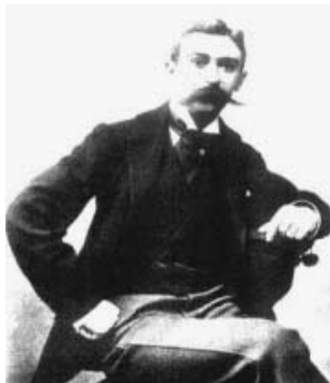
Pierre de Coubertin

Το 1852 μετέβη στο Λονδίνο όπου εργάστηκε ως υπάλληλος στην εταιρεία των θείων του, Λέοντα και Βασιλείου Μελά. σύντομα έγινε συντάκτης στην εταιρεία. Από τους εμπορικούς κύκλους του Λονδίνου εκτιμήθηκε η εργατικότητα, η μεθοδικότητα, η εντιμότητα και η ευρύτητα του πνεύματός του. Ανέπτυξε φιλία με τον πρεσβευτή της Ελλάδας στο Λονδίνο Σπυρίδωνα Τρικούπη και τον γιο του Χαρίλαο, μετέπειτα πρωθυπουργό. Τις ελάχιστες ελεύθερες ώρες του, ο Βικέλας παρακολουθούσε μαθήματα Βοτανικής και Αρχιτεκτονικής στο University College, ενώ εξασκούσε το ταλέν-