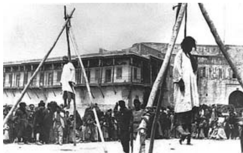
Έλληνες του Πόντου. Δεν αυτοκτόνησαν, τους απαγχόνισαν οι Τούρκοι

Οι μνήμες των προγόνων μας που έγιναν και δικά μας βιώματα δεν παραγράφονται. Η μνήμη είναι δύναμη, αυτή μας κρατά δεμένους με το ηρωικό ιστορικό μας παρελθόν και έτσι επιζησαμε για χιλιετίδες. Η εγωπάθεια ευτυχώς ελαχίστων, που επιδιώκουν παντοιοτρόπως την καθημερινή επικαιρότητα με απαράδεκτες ενέργειες εκτός του ότι είναι καταδικαστές, ευτυχώς είναι εφήμερες. Ο Ελληνισμός ενωμένος ποτέ νικημένος, αυτός ξέρει πώς να πορευτεί όπως έκανε τόσες χιλιετίες, δεν ζητάμε τη βοήθεια κανενός, εμείς θα σας συμβουλεύαμε να ασχοληθείτε με τα μαθήματα της Γαλλικής Φιλολογίας, ίσως εκεί τα καταφέρετε.