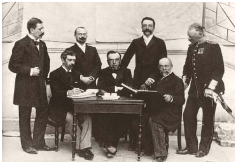
Στη φωτογραφία η πρώτη Διεθνής Ολυμπιακή Επιτροπή. Στο μέσον ο πρόεδρος της Δημήτριος Βικέλας και δεξιά του ο Pierre de Coubertin

Ο διάδοχος Κωνσταντίνος, θερμός υποστηρικτής των Ολυμπιακών Αγώνων, αποφάσισε να ηγηθεί της οργανωτικής επιτροπής. Η απόφασή του αυτή ανακοινώθηκε επίσημα από τον Βικέλα στις 7 Ιανουαρίου