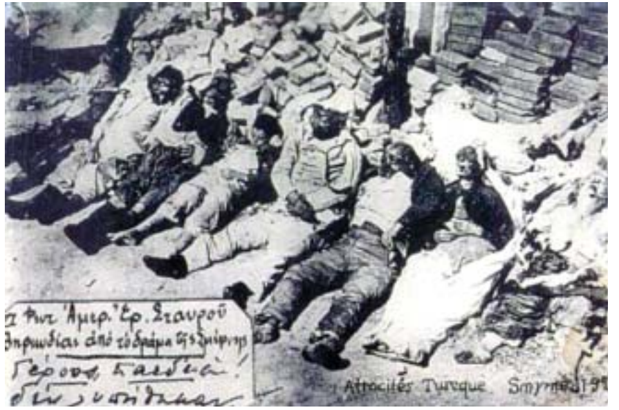
Κορμιά Ελλήνων του Πόντου. Δεν κάνουν ηλιοθεραπεία, τους έκαψαν οι Τσέτες του Κεμάλ

Η γνώμη και η ελευθερία του λόγου κάθε πολίτη είναι δημοκρατικό και συνταγματικό δικαίωμα. Η άποψη όμως του πολίτη που κατέχει δημόσιο αξίωμα με το οποίο επιβάλλει ή διαμορφώνει την κοινή γνώμη πρέπει να κρίνεται και να στηλιτεύεται. Σύνθηδες φαινόμενο της εποχής, μας είναι αδιάφορος ο τρόπος ανέλιξης της κυρίας «Μαρίας» που τα τελευταία τρία χρόνια